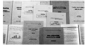
調査・研究報告書類

アジア女性基金では、問題への現実的かつ効果のある対応策を考えるためにも、まず実態を把握することに努めました。(調査研究報告書126ページ参照)